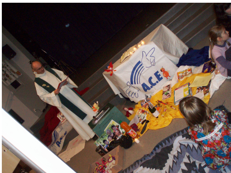
La messe célébré par l'aumônier de l'ACE