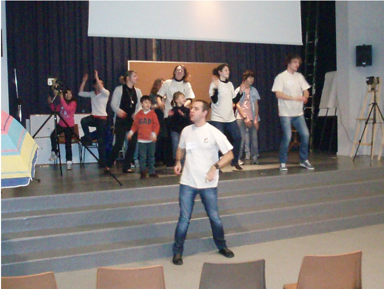
J'ai appris la danse de l' ACE.