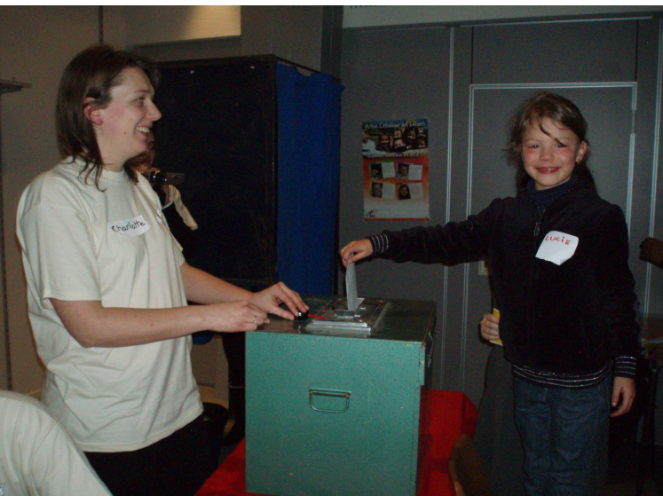
Nous avons tous voté le thème de l'année. Nous avons fait comme les adultes.